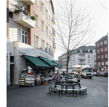
Grønthandler på Frederikssundsvej