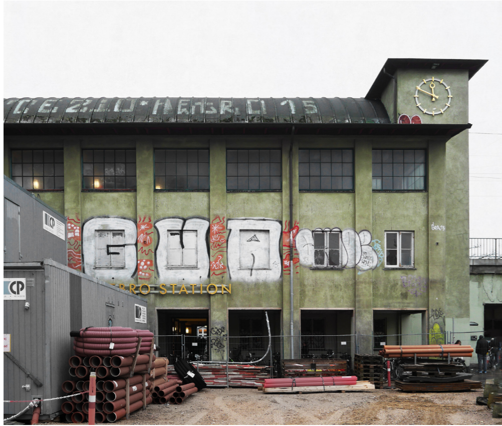
Nørrebro Station set fra den kommende metroplads