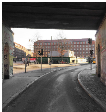
Trekantsgrunden set fra Nordvestsiden