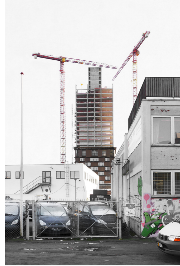
Industriområdet nord for Frederikssundsvej i Nordvest