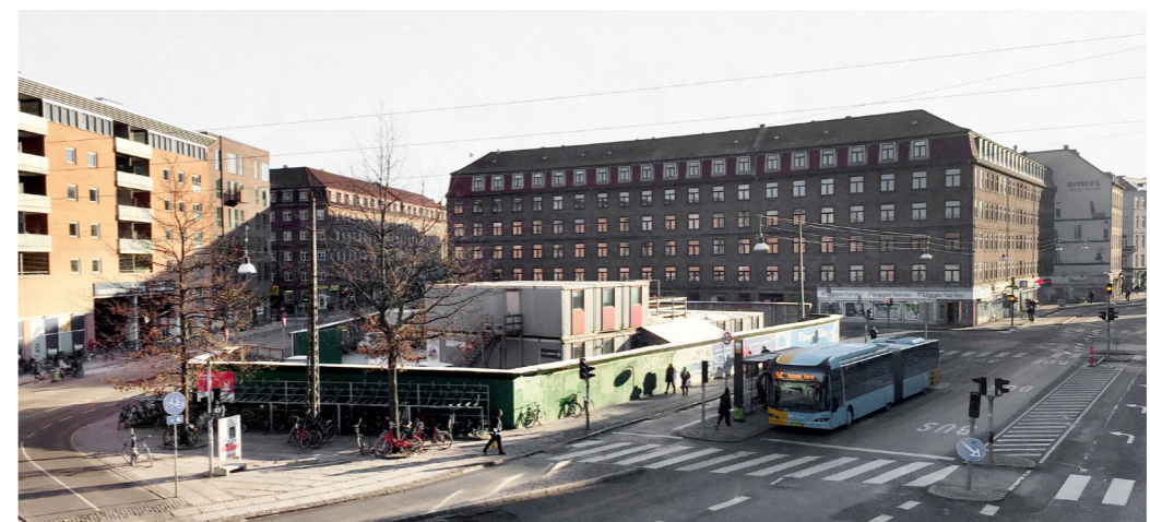
Den trekantede grund fungerer i dag som metrobyggeriets opbevaringsplads