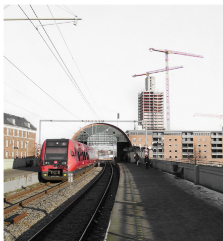
Nørrebro Station set fra togperronen