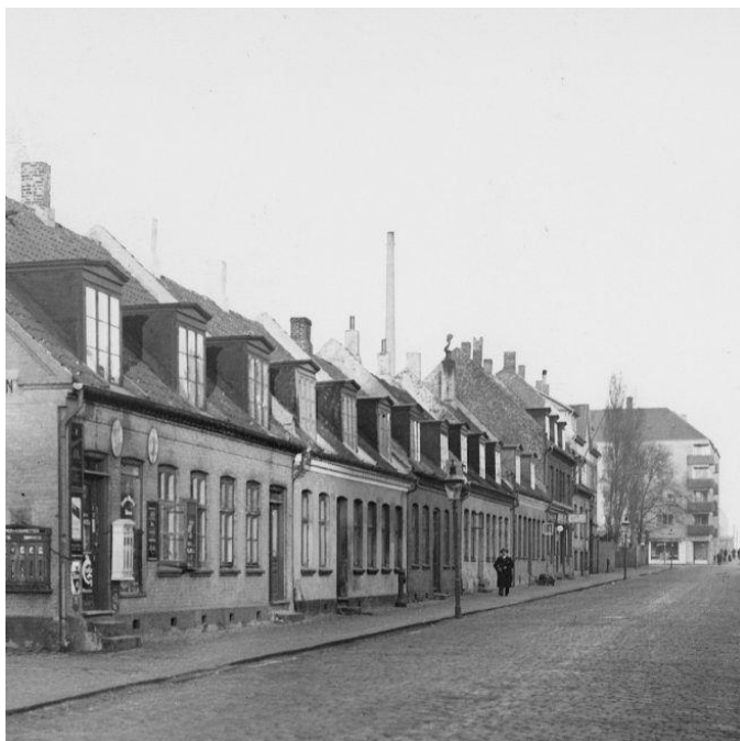
Bildet er fra 1953 og sett fra hjørnet av Nannasgade og Rådmandsgade, mot Tagensvej. 3