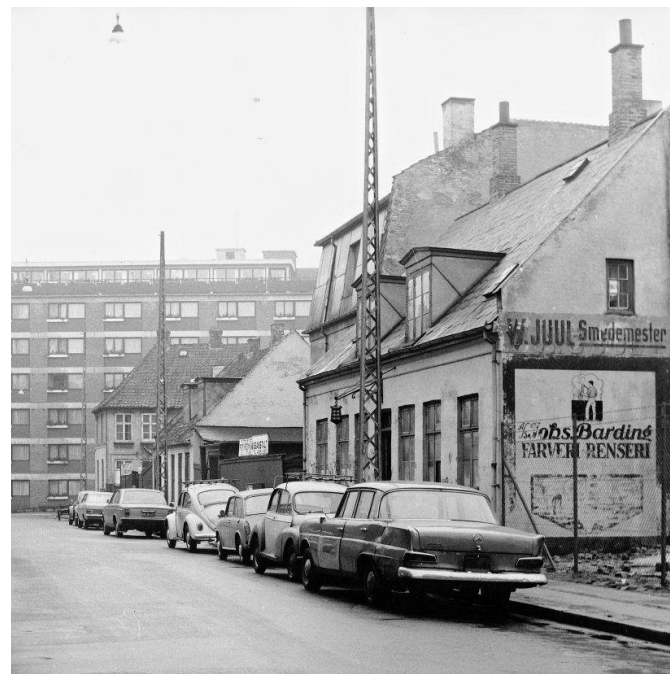
Bildet er fra 1973 og sett mot Dagmarsgade. Det viser den andre siden av gaten av der sitet til prosjektet er. I dag ligger det en enetasjes daginstitusjon der. 4