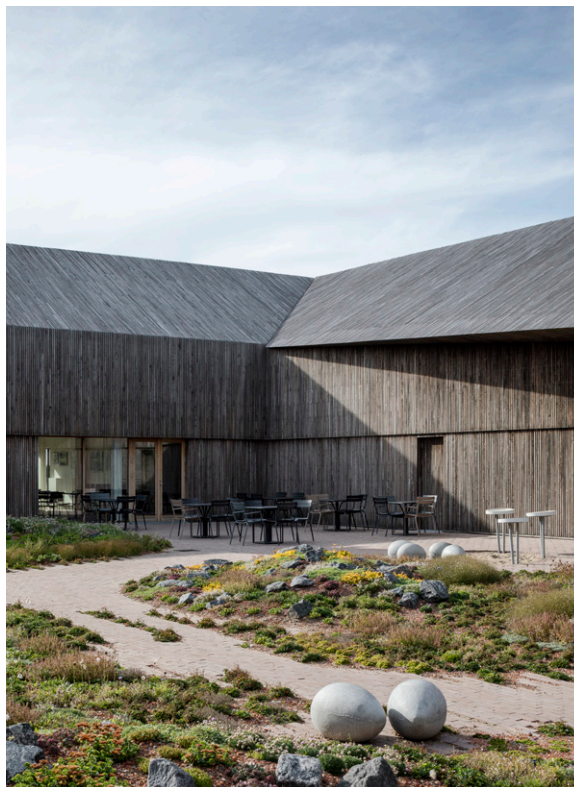
2. Terra Incognita, Trondheim