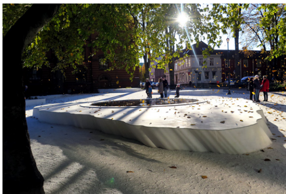
1. K.B Hallen, Frederiksberg