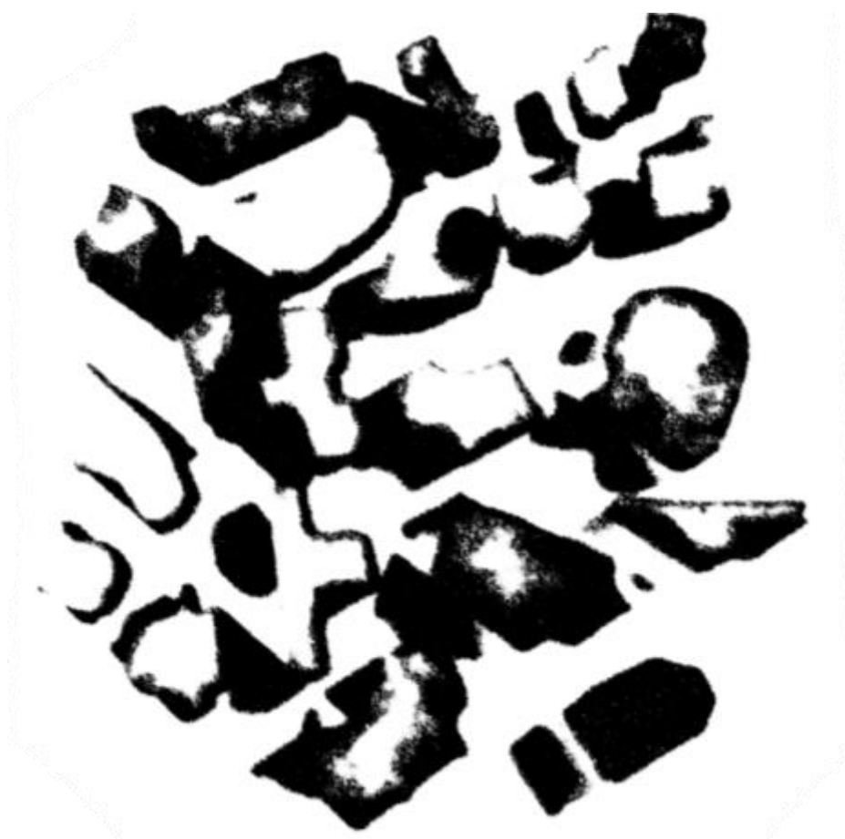
Interventioner og udlægninger, eksempel

Afslutningsvis gennemføres en udlægning af 300 elementer – først samlet og undersøgt i grupper af 10, derefter i grupper af 20 og sluttelig sammenføjet til et samlet felt.