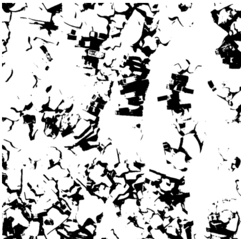
Fortolkninger og transformationer, eksempel

I dette materiale vil vi udvælge et række arbejder, der optegnes og målsættes med henblik på fremstilling af nye modeller på et senere tidspunkt.