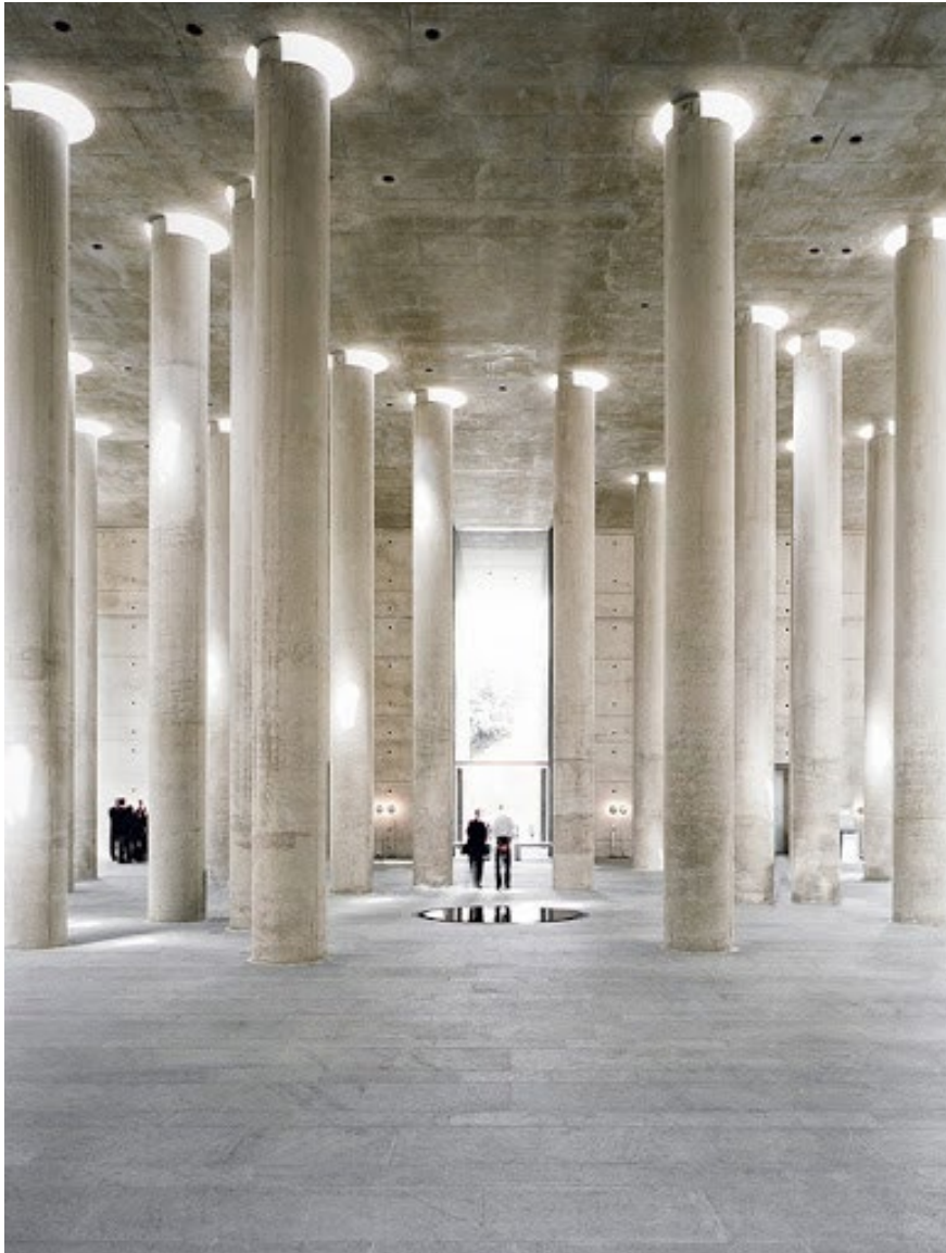
Treptow Krematorium , Berlin (5)