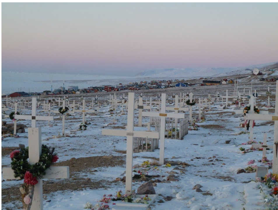
"Hvem har dog vist det mod og den handlekraft at placere en kirkegård midt i det uendelige landskab?" - Lone van Deurs