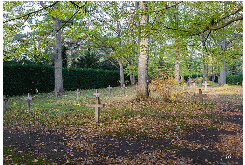
Marielbjerg kirkegård | Gentofte, Danmark