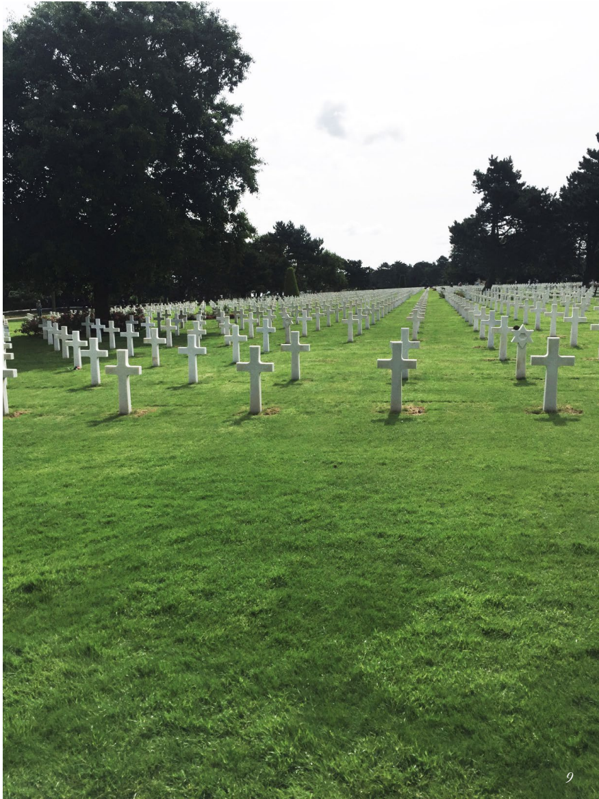
Amerikansk mindesmerke | Normandiet, Frankrig