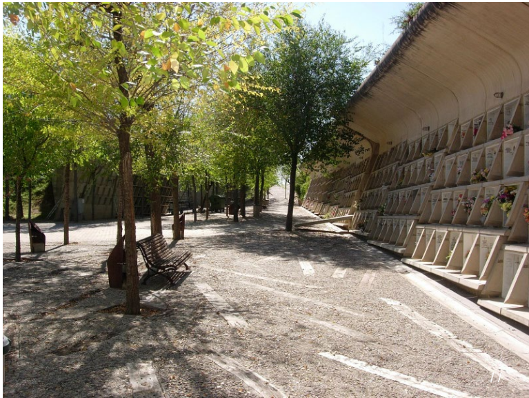
Igualada Cemetery | Barcelona, Spanien