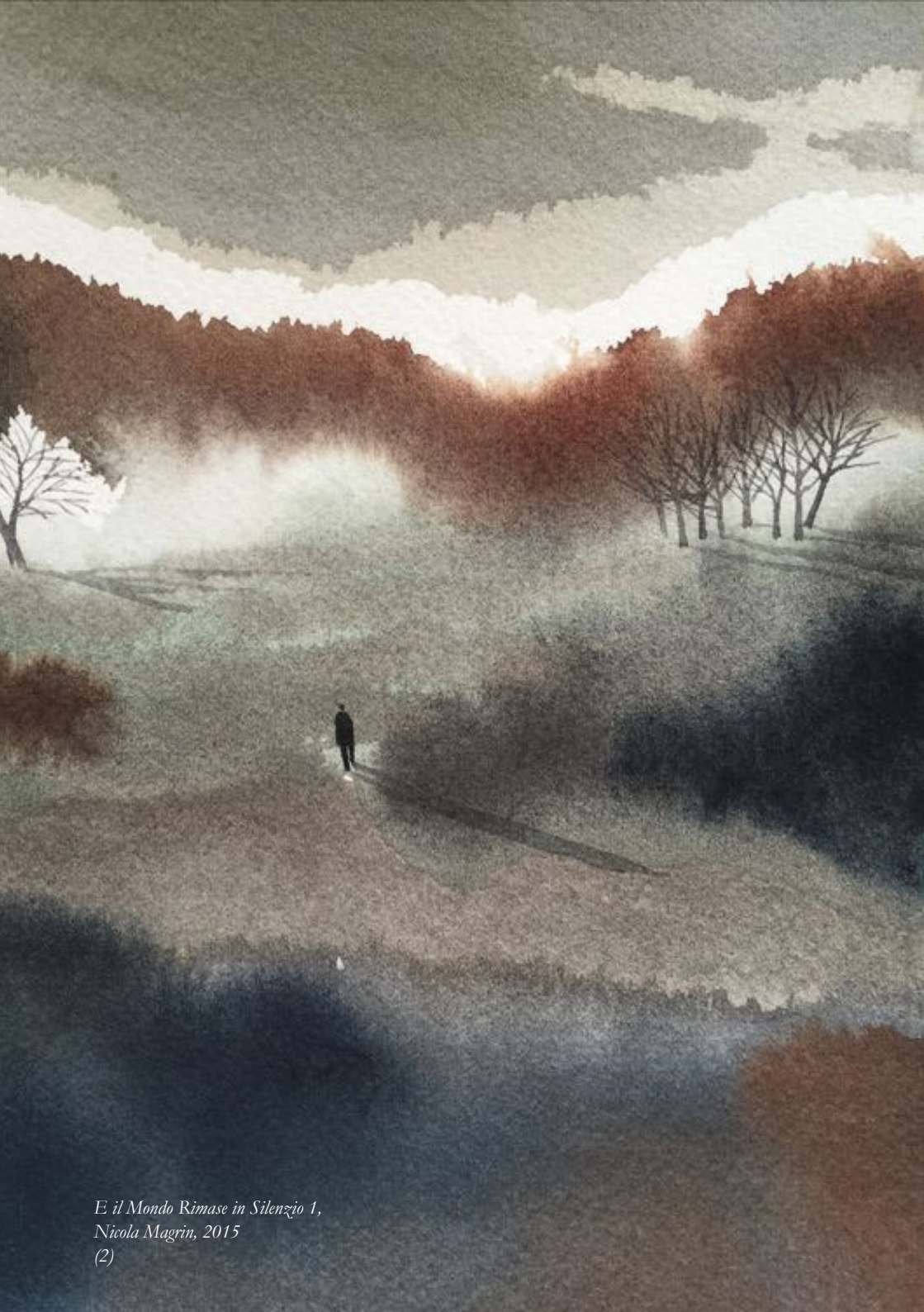
E il Mondo Rimase in Silenzio 1, Nicola Magrin, 2015 (2)